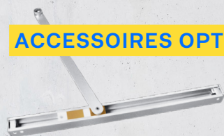
Bras à coulisse T-Stop antivandale limiteur d'ouverture intégré