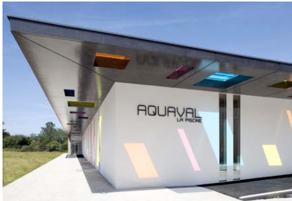
Maîtrise d'ouvrage : Saint Brieuc Agglomération Architecte : Thierry NABÈRES, Agence TNA